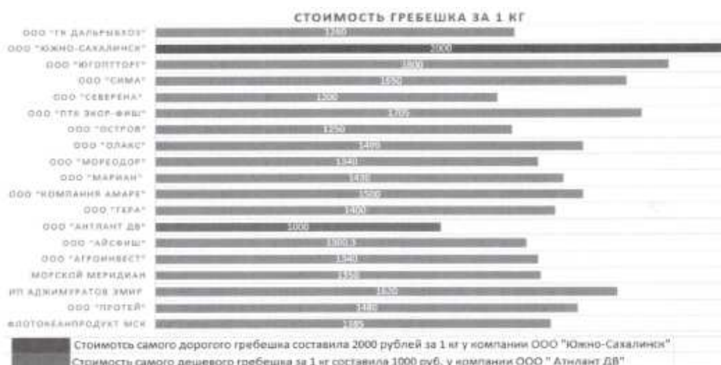
Рис. 1. Стоимость гребешка в Российской Федерации за 1 кг в рублях

Стоимость гребешка в Российской Федерации представлена на рисунке 1. Цена варьируется от 1050 до 3000 рублей за 1 кг. Динамика статистической стоимости трепанга представлена на рисунке 2 (тыс.долларов США) [10].