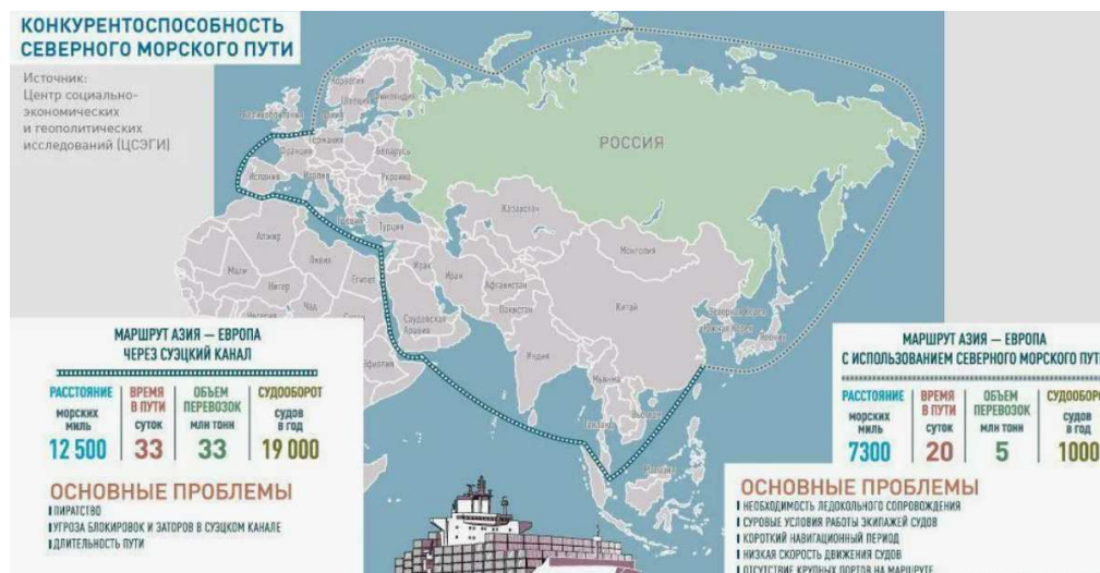
Рис. 3. Северный морской путь и Южный морской путь на карте

Безопасность – ключевое преимущество СМП; он проходит по внутренним водам России, что гарантирует соблюдение единой юрисдикции, централизованное управление движением судов (включая ледокольное сопровождение) и отсутствие угроз со стороны третьих стран или пиратов. Это делает арктический маршрут не только предсказуемым, но и защищенным от геополитической нестабильности.