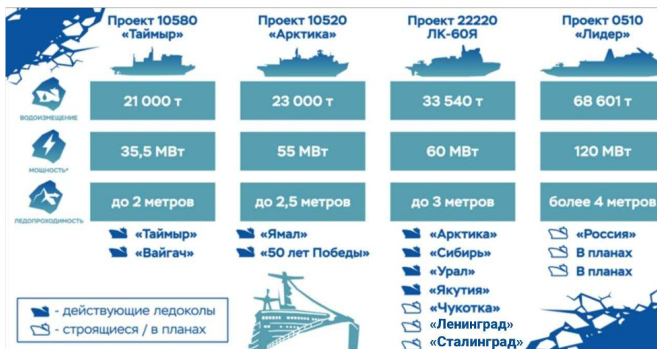
Рис. 4. Атомный ледокольный флот России

По состоянию на 2025 г. в составе ледокольного флота РФ 42 ледокола: 34 дизель-электрических и восемь атомных ледоколов (из них четыре – нового проекта 22220). Новый ледокол – «Якутия» – вошел в состав флота в марте 2025 г. Заложены еще три ледокола: «Чукотка» и «Ленинград» проекта 22220, а также атомный головной ледокол «Россия» проекта «Лидер».