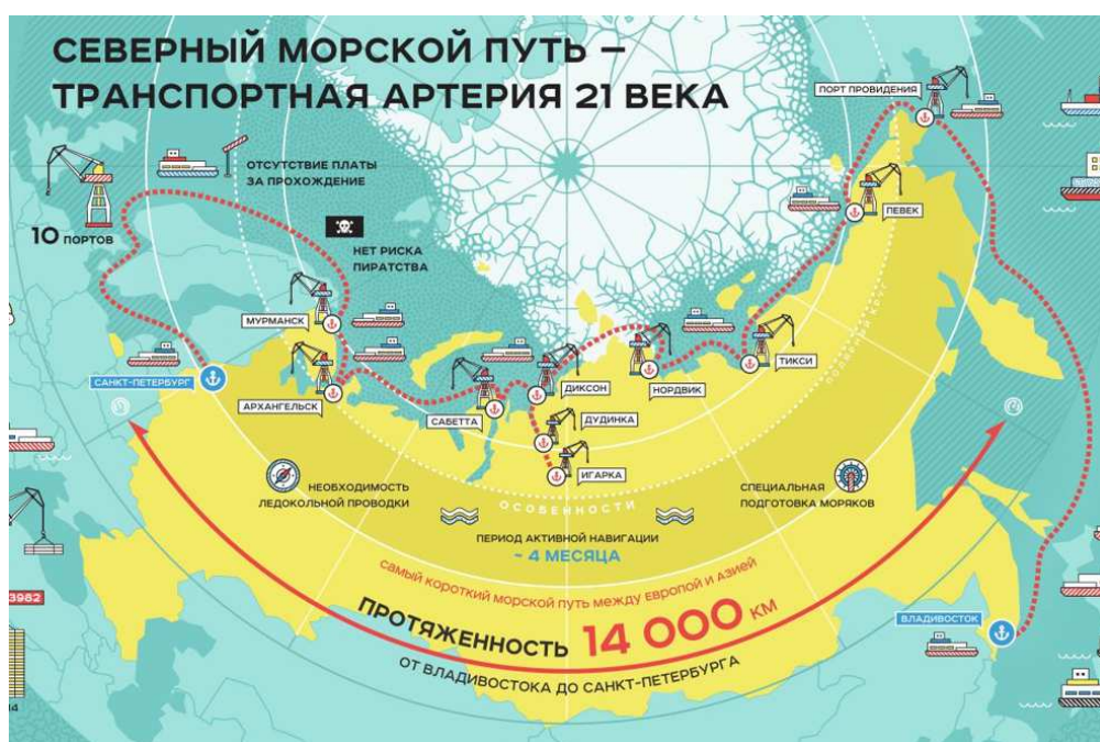
Рис. 1. Северный морской путь на карте

Формируемая на Дальнем Востоке России система МТК включает в себя Северный морской путь в рамках Северного морского транзитного коридора. По административным данным протяженность СМП считается от Карских Ворот до бух. Провидения; составляет 5600 км. Однако исторически СМП всегда рассматривали и развивали как единую транспортную коммуникацию по Северному Ледовитому океану от северных портов Мурманск и Архангельск до порта Владивосток (рис. 1). Поэтому сейчас в правительстве обсуждается концепция Большого Северного морского пути под названием «Северный морской транзитный коридор» или «Трансарктический транзитный коридор», который начинается в Санкт-Петербурге и заканчивается во Владивостоке. Его протяженность составит 14 280 км.