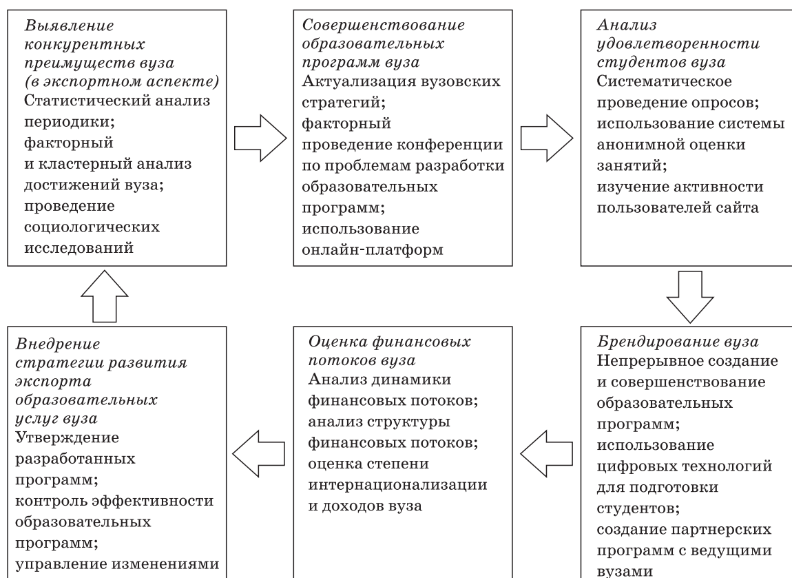
Рис. 1. Модель стратегических направлений развития экспорта образовательных услуг на уровне вуза Fig. 1. Model of strategic directions for the development of export of educational services at the university level