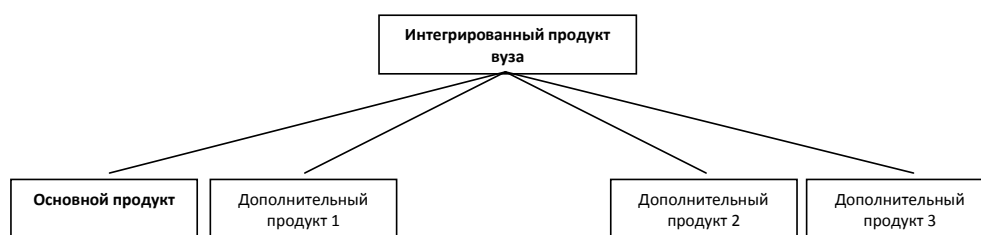
Рис. 4. Структура интегрированного продукта вуза

исследовательской деятельности), т.н. «имиджевый продукт» (дополнительный продукт 3).