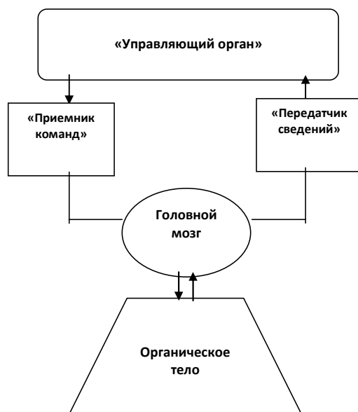
Рис. 1. Схема функционирования системы «человек»

Если органическое тело человека является объектом управления , то в качестве субъекта управления выступает некий «Управляющий орган» («Компьютер»). Причем местонахождение «Управляющего органа» («Компьютера») кибернетическая антропология не уточняет.