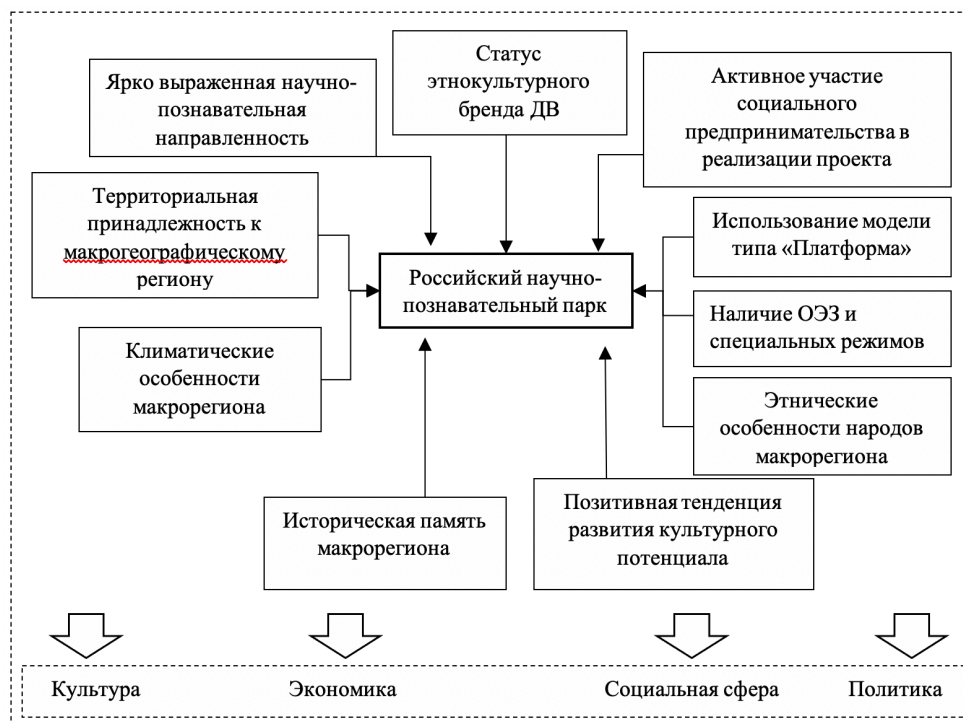
Рисунок 1 – Основные составляющие российской модели научно-познавательного парка

познавательных проектов авторами предлагается методика, основанная на детальном изучении региональных научно-познавательных проектов, анализе выделения эффекта социального предпринимательства.