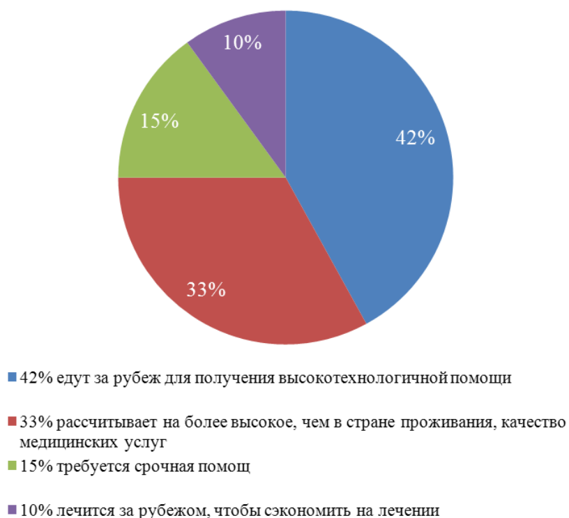
Рис. 1. Мотивация медицинского туризма

Могут быть и другие побудительные мотивы. Например, отдельных людей интересует возможность совмещения лечения с туристской программой в другой стране (фактор добавленной стоимости). В отдельных случаях пациентов интересует полная анонимность лечения. По данным исследований McKinsey and Company [27] мотивация туристов медицинского сегмента имеет структуру представленную на рис. 1. Однако, это усредненные цифры, которые могут существенно отличаться от страны к стране.