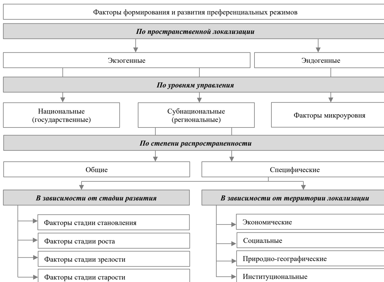
Рисунок 2. Система факторов формирования и развития преференциальных режимов (составлено авторами)

Учитывая вышесказанное, нами предложена система факторов формирования и развития преференциальных режимов в рамках двух основных критериев: по уровням управления и по стадиям их развития (рис. 2).