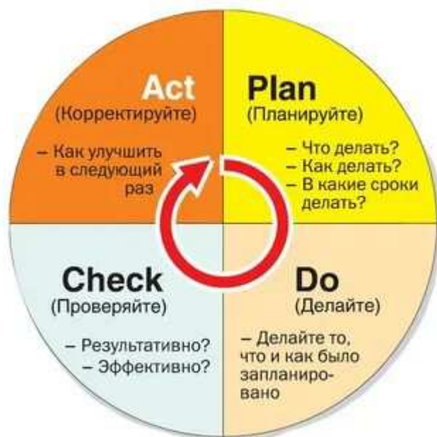
Рис. 2. Цикл PDCA

Модель EFQM (European Foundation for Quality Management) – это модель Европейского фонда управления качеством, которая призвана стимулировать организации улучшать качество выпускаемой продукции и качество управления. Этот фонд был организован в 1987 году 14 ведущими европейскими компаниями. Данная модель активно применяется в сфере образования.